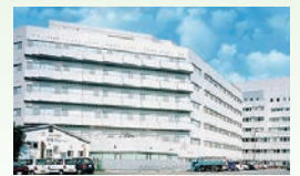
軽費老人ホーム ケアハウス元総社