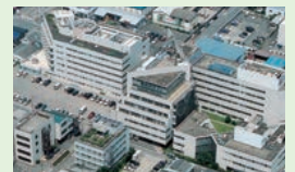
(公財)老年病研究所グループ全景