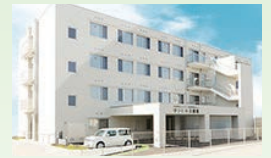
介護付有料老人ホーム サンヒルズ総社