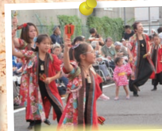
【清里だんべえ部会】