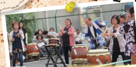
【上州大胡風神太鼓】

サンライフ問屋町駐車場にて納涼祭を行いました!! 開催時間が近づくにつれて雲行きが怪しくなり 空を見上げているうちに土砂降りの雨が降って きて開催が危ぶまれましたが、皆の願いが天に 届いて雨上がりの綺麗な夕焼けのなか予定通り開催 することができました!!