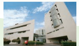
(公財)老年病研究所附属病院