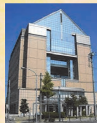
《群馬県社会福祉総合センター》

〒371-8517 群馬県前橋市新前橋町 13-12 群馬県社会福祉総合センター5階 TEL : 027-255-6400 / FAX : 027-255-6166 URL : http://www.gunma-long.or.jp/