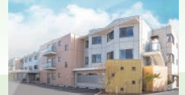
特別養護老人ホーム サンライフアネックス