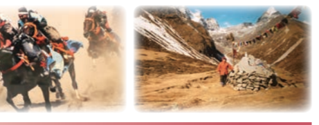
金澤 君江 様 (88歳)