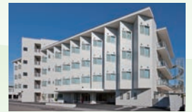
特別養護老人ホーム サンライフ問屋町