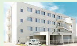
介護付有料老人ホーム サンヒルズ総社