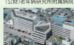
(公財)老年病研究所グループ全景