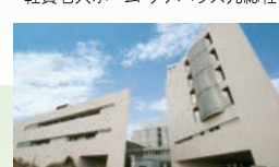
(公財)老年病研究所附属病院