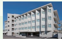
特別養護老人ホーム サンライフ問屋町