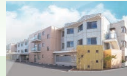
特別養護老人ホーム サンライフアネックス